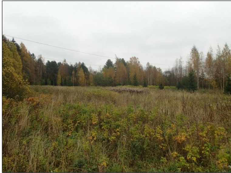
Alueen lounaisosassa on heinää kasvavaa vanhaa peltoa