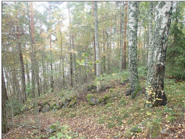
Tutkittavan alueen länsi- ja kaakkoisosassa maasto on pääosin kivikkoista jyrkkää rinnettä.