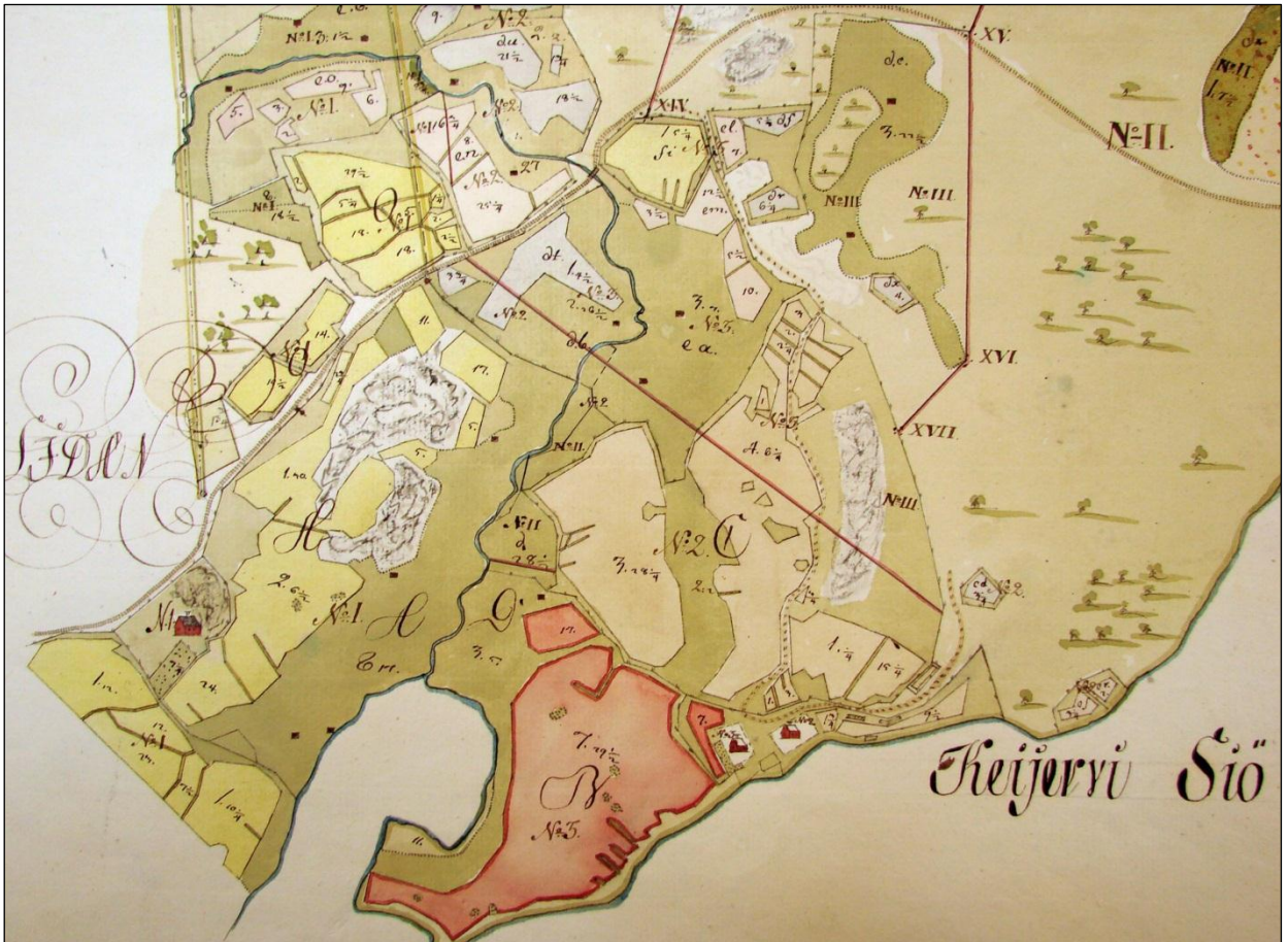
Vuoden 1765 (H6:14/1-5) kartta, jossa Kuusiston kylään on merkitty kaksi taloa.