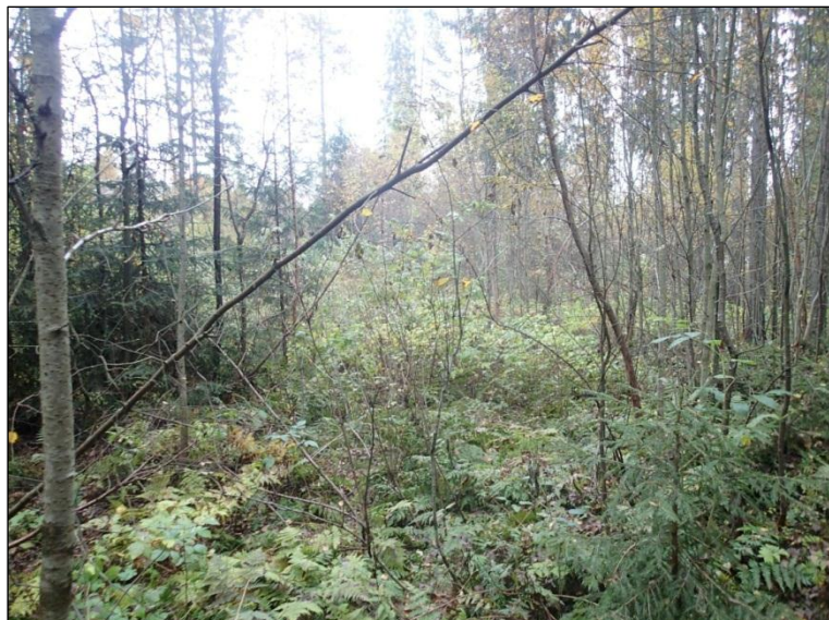
Aivan alueen pohjoisimmassa nurkassa maasto on kosteaa lehtipuultaista sekametsää.